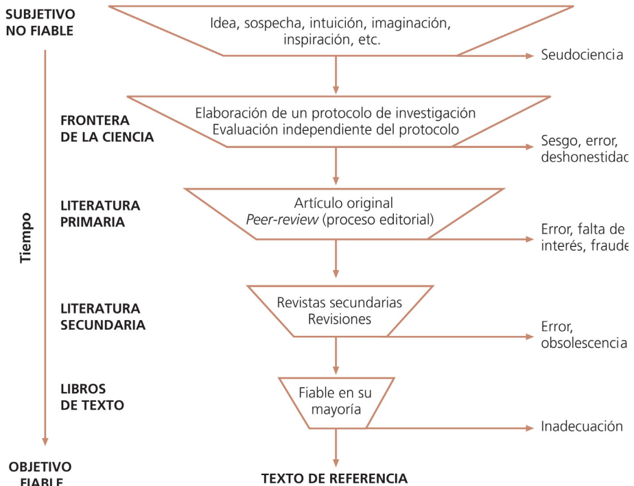
FIGURA 1.2 Filtro del conocimiento.

los que pasan a formar parte del cuerpo de conocimientos vigente (fig. 1.2).